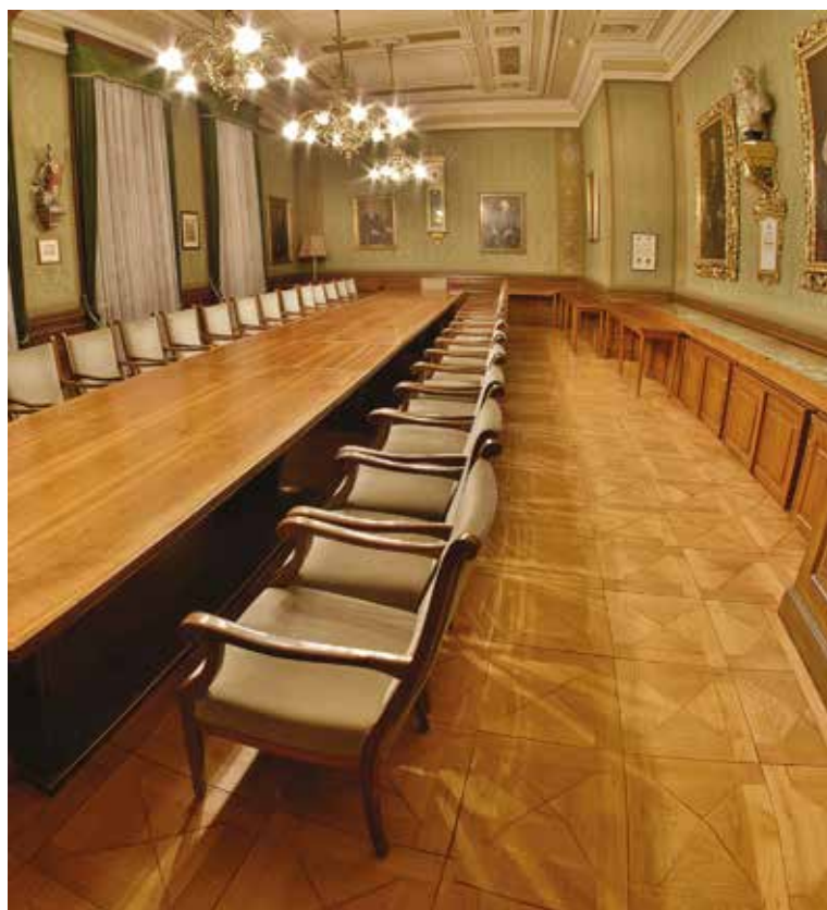
Зал засідань генеральної дирекції у м. Грац