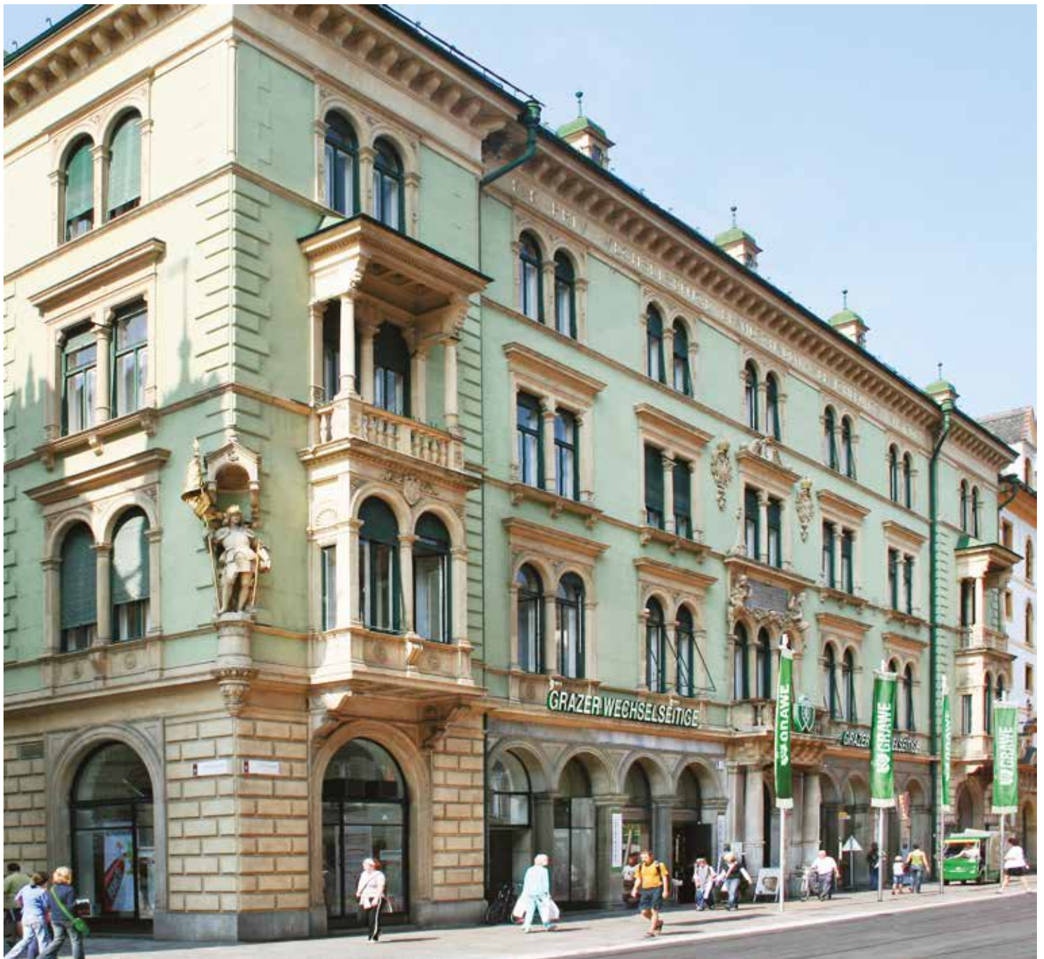
Центральний офіс у м. Грац

Індивідуальність кожної країни, національностей, людей, різноманіття їхніх цінностей, відносин, поєднується в єдине джерело, яке гарантує міць, силу та надає величчю концерну GRAWE. Бути відкритим, розуміти потреби кожного клієнта, йти на зустріч, прагнути до нових досягнень, перспектив, позитивних змін – це головні завдання і складові стратегії подальшої діяльності всіх компаній у складі концерну. А комерційний успіх дає користь економіці кожної країни, де представлена страхова компанія концерну GRAWE.