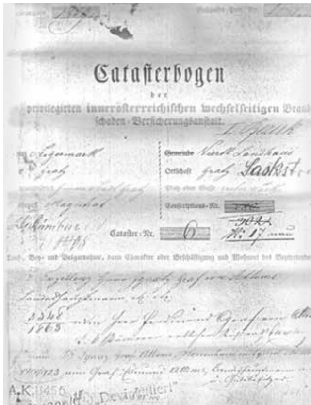
Договір укладений у 1829 р., який діє і донині

Десятки тисяч українських споживачів назвали «ГРАВЕ УКРАЇНА» найнадійнішою страховою компанією.