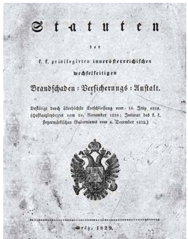
Статут 1829 р.

Висококваліфіковані спеціалісти компанії-засновника, головний офіс якого знаходиться в Австрії у місті Грац, координують роботу усіх компаній концерну, гарантуючи власним досвідом надійність та бездоганну якість обслуговування клієнтів.