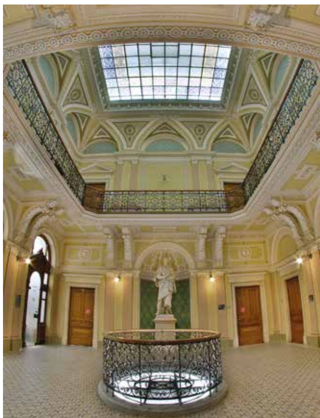
Хол генеральної дирекції у м. Грац

Національний банк України, що здійснює державне регулювання у сфері ринків фінансових послуг підтвердив: ГРАВЕ УКРАЇНА – прозора, надійна та стабільна страхова компанія, що працює на теренах України та бере на себе фінансові зобов'язання й вчасно їх виконує. Це вкотре офіційно підтверджено рішенням Регулятора у квітні 2023 року.